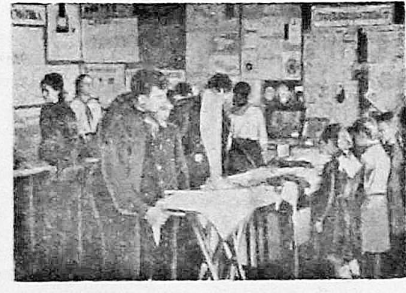
В дни школьных каникул в городском Доме пионеров открылась выставка детского творчества. В многочисленных залах представлено более 5 тысяч различных экспонатов. На выставке можно увидеть много различных изделий из дерева и металла, изготовленных в школьных мастерских. Внимание посетителей привлекают учебные пособия по химии, изготовленные учениками 14-й средней школы. Большой раздел выставки посвящен художественному творчеству. На снимке: в зале выставки детского творчества.

Выступление мастерицы местного искусства горячо встречено зрителями. Большое впечатление произвело исполнение русских народных песен «Над полями да над чистыми», «Чернобровый, черноокий», «Помню, я еще молодухой была», «Что ты жадно глядишь на дорогу» и др.